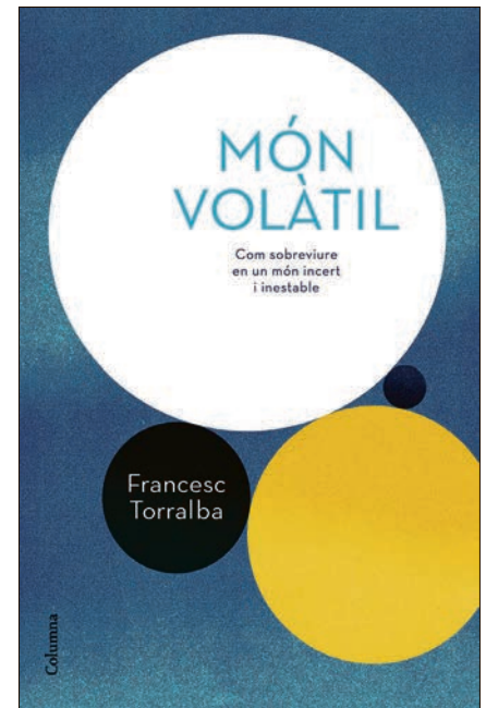
Portada del llibre, editat per Columna.

El qui té mercat en el món volàtil és el qui ofereix un paquet de seguretats, una terra sòlida i una brúixola per orientar-se. En l'àmbit religiós, veiem grups molt emotivistes que volen salvar els ciutadans de la inquietud i del desassossec. El cristianisme no es pot presentar així, seria fer-ne un ús instrumental. El cristianisme ens obliga a sortir a la intempèrie. No n'hi ha prou de tocar les campanes i esperar que vingui la gent, perquè és que no venen. El cristianisme, tal com l'hem conegut, s'ha volatilitzat.